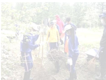
【地域貢献活動(於宝蔵院)】